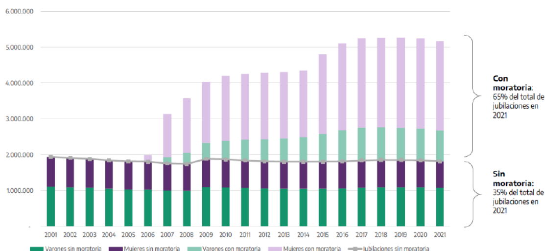
Gráfico 1. Evolución de la cantidad de jubilaciones, con y sin moratoria, por sexo. Período 2001-2021.

Fuente: Boletín estadístico de la Seguridad Social (BESS) elaborado por el Ministerio de Trabajo, Empleo y Seguridad Social (MTEySS).